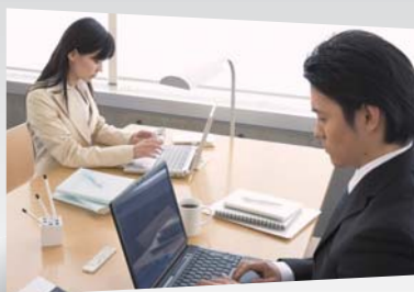
部署内のメール共有・管理 複数アドレスの一元化に