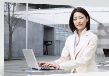
安心して利用できる メール環境を社外でも