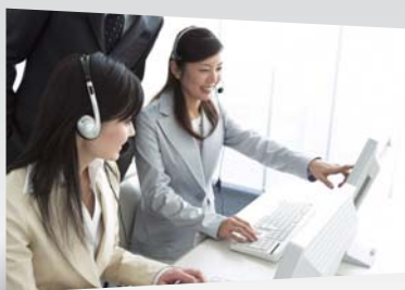
サービス・ショップなどの カスタマーサポート業務に

メール自動振り分け 共有テンプレート機能 アドレス帳機能 メールデータバックアップ